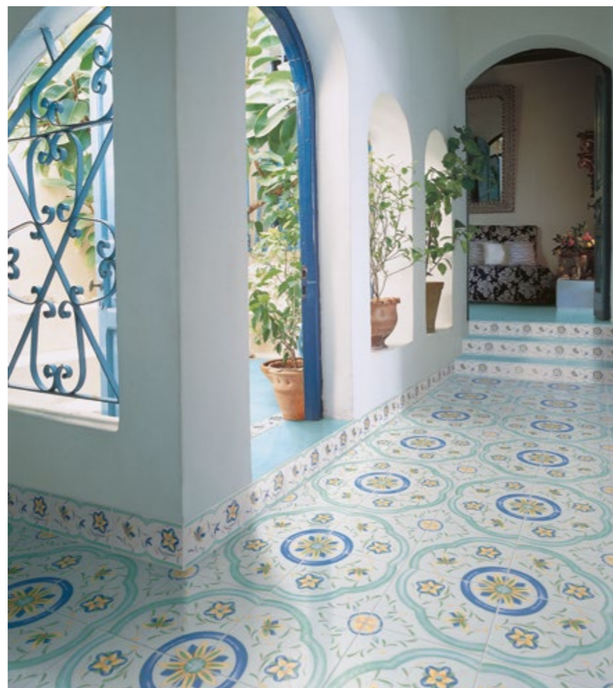
Antiche Riggiole Napoletane Posillipo 34x34, Fascia Posillipo 17x34

L'arte della «Riggiole» ha origine amalfitana e sorrentina nel 1450. «O' Riggiole» è il mastro, che ha il compito di ornare in quell'epoca le stanze del primo Re Aragonese della storia, Alfonso il Magnanimo. Il mastro è l'unico che ha le abilità e le competenze che necessitano per ornare tale sfarzo, è l'unico che ha le abilità per comporre tali pavimentazioni. Abbiamo fatto nostro questo onere, l'onere di essere gli unici a portare questo imponente racconto, nella vita di tutti i giorni, facendo vivere a tutti coloro che nel corso degli anni hanno scelto di vestire i propri spazi con questa collezione, un tratto narrato di storia e regalità. I colori tipici e le decorazioni completano un'opera sublime, un'opera d'altri tempi. Unicità, Regalità' e Arte